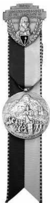
Einzelauszeichnung: Kranz oder Kranzkarte