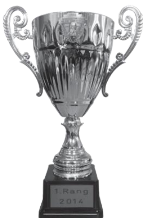
Grosser Rothenthurmer Becher 300m