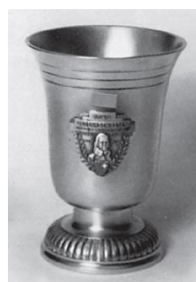
Kleiner Rothenthurmer Becher 300m