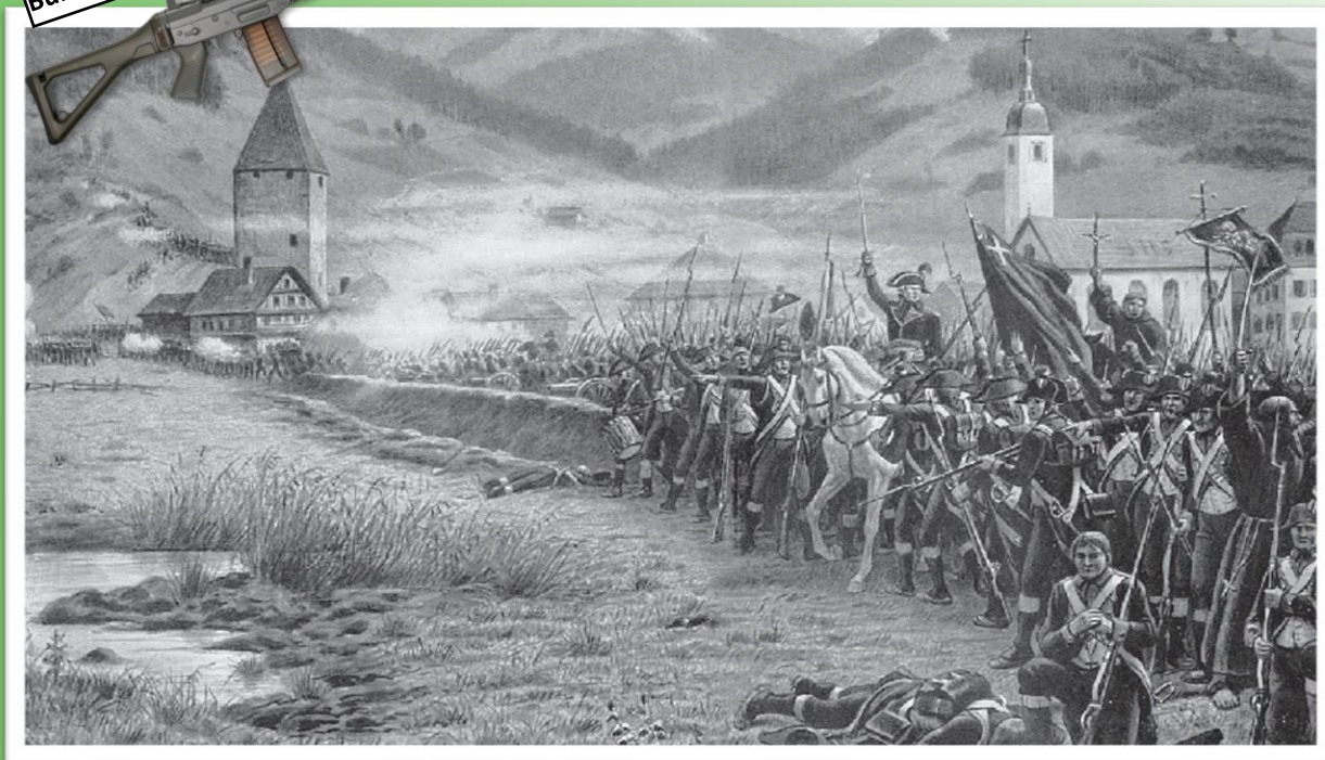
Gefecht zwischen den Schweizern und Franzosen am 2. Mai 1798 am Rothenthurm