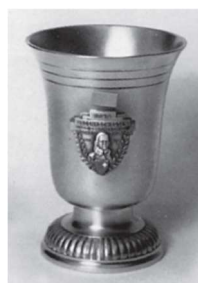
Kleiner Rothenthurmer Becher 300m