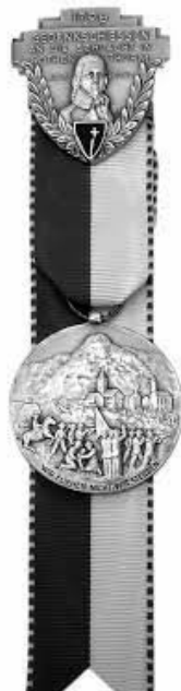
EINZELAUSZEICHNUNG: Kranz oder Kranzkarte