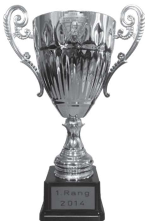
Rothenthurmer Becher 300m